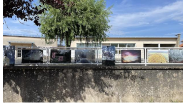
Juin/Août : Défi photographique SVP-VE et exposition des photos dans tout le village