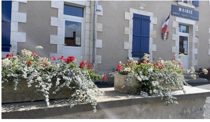
Nouveau fleurissement du village