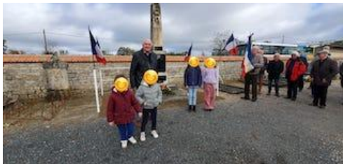
11 novembre : cérémonie au monument aux morts