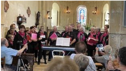
11 juin concert de la Chorale de La Châtre dans notre église