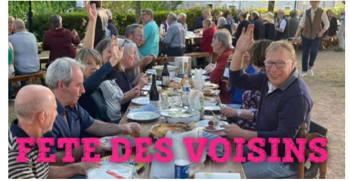
Fêtes des voisins