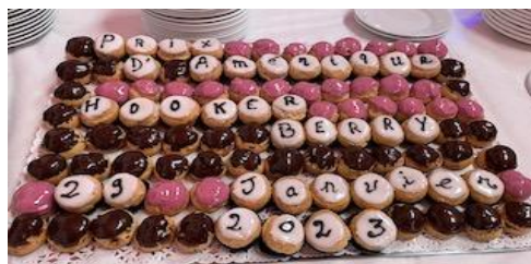
2 Décembre : Repas Hooker Berry