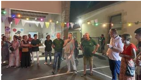
8 Juillet : Fête d'été/Boeuf (Comité d'animation)