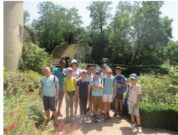
Vacances d'été au centre de Loisirs