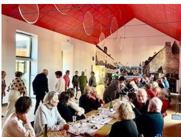
26 Novembre : Repas intergénérationnel