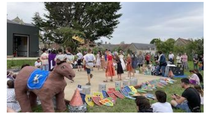
1er juillet : fête des écoles Spectacle sur le thème du Moyen-Age