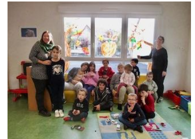
Vacances de Toussaint/Halloween/portes ouvertes au Centre de Loisirs