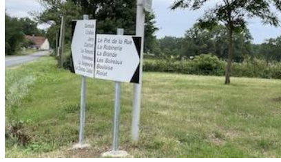
Pose des panneaux de fléchage des numéros, hameaux et lieux-dits