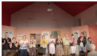
12 Novembre : pièce de Théâtre "Tiercé gagnant" (organisé par SVP-VE)