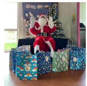
21 Décembre : Noël au Centre de Loisirs