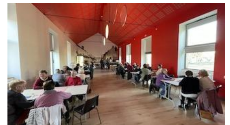
19 Novembre : après-midi jeux de société (Familles Rurales et Bibliothèque)