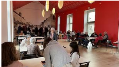
21 Janvier : Après-midi jeux de société (Familles Rurales)