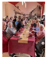
18 Février : Saint Blaise Saint Vincent (Comité d'animation) Procession à la Croix de l'Orme, apéritif/galette et repas à la salle des fêtes