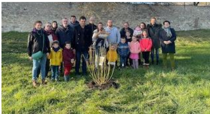
11 Février : Plantation d'un arbuste en l'honneur des enfants nés cette année