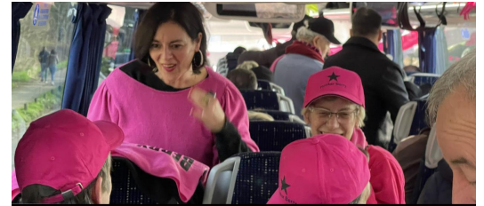
29 Janvier : En route vers Vincennes