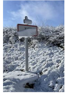
18 Janvier : Le village sous la neige