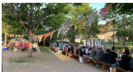
26 Mai : Plus de 75 personnes réunies pour cette première édition de la Fête des Voisins place de l'église