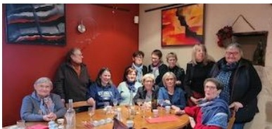
8 Mars : Journée de la femme Repas à La Forge de Vicq