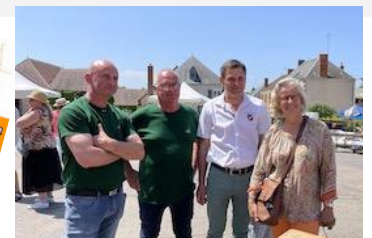
28 Mai : Brocante organisée par le comité des fêtes avec la visite de Nadine Bellurot Sénatrice de l'Indre