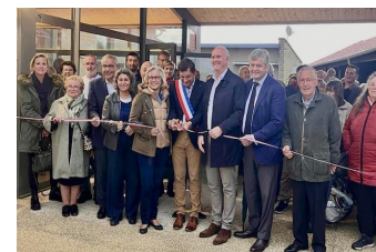
13 Mai : Inauguration de la salle de l'Aubois, façade de l' église et vitraux, et façade de la mairie