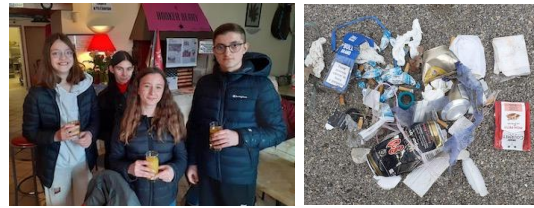
18 Février : Randonnée des jeunes Deux parcours pédestres et deux parcours VTT Ramassage des déchets. (Familles Rurales)