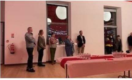
6 Janvier : Les vœux de Monsieur le maire