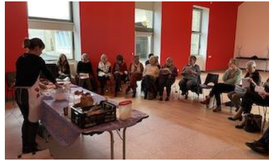
28 Janvier : "Atelier "Cuisine et santé" (Familles Rurales)